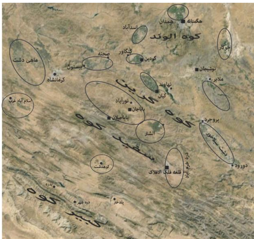
تصویر ۲. موقعیت شهرها، دشت‌های میان‌کوهی و استقرارهای مهم در توپوگرافی منطقه