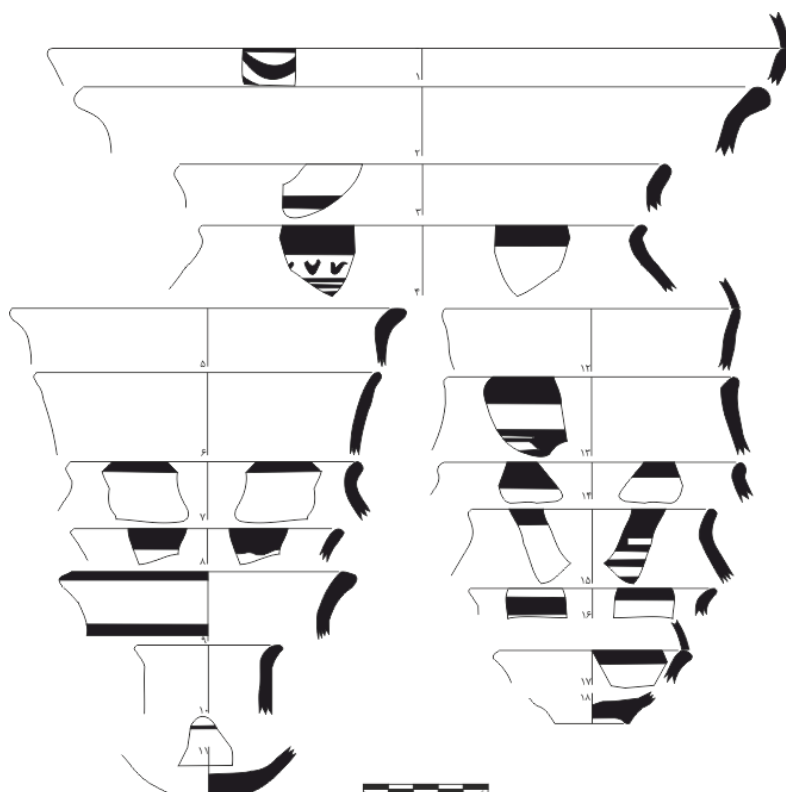
شکل ۲. نمونه‌ای از طرح سفال‌های یافت‌شده از لایه‌های استقرار مربوط به دوره گودین ۳ در محوطه فلک‌الافلاک خرم‌آباد