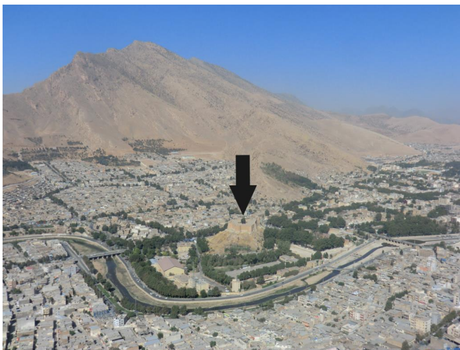
تصویر ۳. موقعیت قلعه فلک‌الافلاک نسبت به شهر و رودخانه خرم‌آباد، دید از جنوب شرق (نگارندگان، پاییز ۹۵)