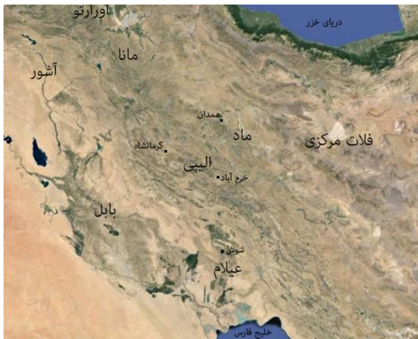
تصویر ۱. وضعیت سیاسی منطقه در سده‌های آغازین هزاره اول پ.م.