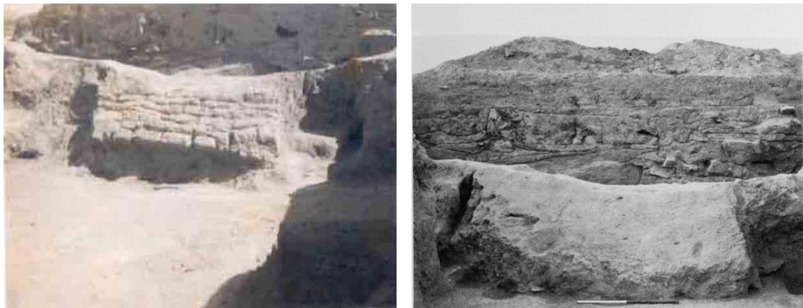
تصویر ۲: گودین III2: سقوط دیوار بین دو اتاق که از پایین در خط کف جدا شده (Young, 1969: 127).

گودین III2 با گیان III، گیان IVc و گورهای ۱۰۸ و ۱۱۰ گیان IVB هم‌دوره است. هم‌زمان با متروک شدن تپه گودین در اواخر این مرحله استقرار در تپه گیان نیز متوقف شده است (Contenue & Girshman, 1935). این هم‌زمانی در متروک شدن محوطه‌ها می‌تواند بیانگر رویدادی باشد که در کل منطقه رخ داده است. برپایه تاریخ‌گذاری رادیو کربن برای فاز III2 گودین تپه، تاریخ ۱۹۰۰-۱۶۰۰ پ.م. تعیین شده است (Henrickson, 1987: 224)؛ بنابراین احتمالاً رخ داد زلزله در بازه زمانی ۱۶۵۰-۱۶۰۰ پ.م. و در اواخر فاز III2 گودین اتفاق افتاده است. فاز پس از III2: از این مرحله هیچ شواهد معماری به دست نیامده است. تنها دو گور با تدفین سالم یافت شده است. این مرحله در تمام دشت کنگاور و نواحی اطراف نیز تنها از قبور شناسایی شده و شواهد استقراری به دست نیامده است (Gopnik & Rothman, 2011: 205; Henrickson, 1987: 51).