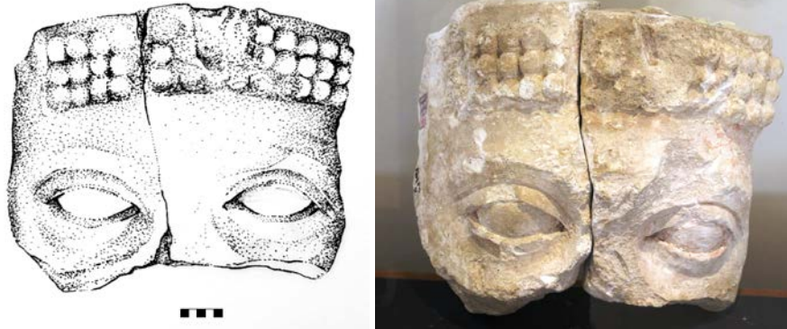
تصاویر ۵ و ۶. تکه‌ای از صورت گچی.

ضعیفی از ابروان قابل مشاهده است و موی مرد مانند اسلاف هخامنشی‌اش، به شکل مجعد نشان داده شده است که روی پیشانی هم آمده است. البته باید این موضوع را ذکر کرد که گچ‌بری‌های دور طاقچه‌ها همگی منقوش و رنگ زده بودند، رنگ‌ها شامل زرد، سیاه و قرمز بوده است.