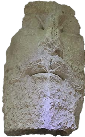
تصویر ۲. سردیس متصل به تاج.

بدنه متصل می‌شده که این بدنه، یک سردیس گچی است. بخش تحتانی آن با گوی‌های برجسته مزین شده و روی آن نیز دوایری که در اصل متحدالشکل نبوده، قرار دارد که زنجیروار به هم وصل شده‌اند. میانه و قسمت فوقانی تاج نیز با طرح‌های قاشقی ساخته و کنگره‌دار نشان داده شده است.