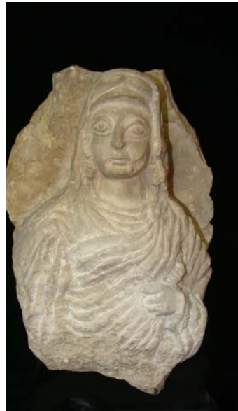
تصویر ۹. بانوی پارسی (موزه سردار آسمانی) تصویر ۱۰. بانوی پارسی (www.metmuseum.org).