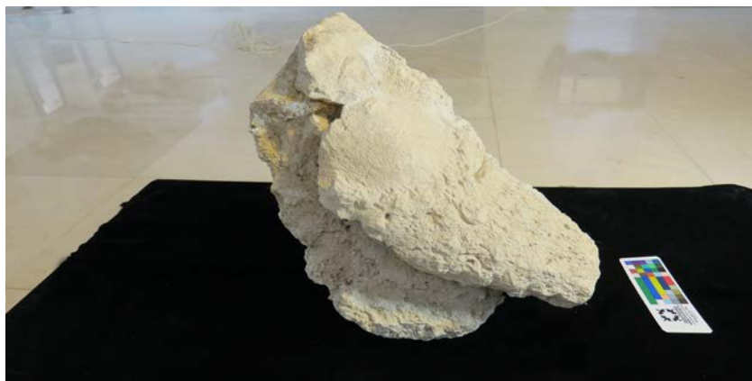
تصویر ۳. نمایی دیگر از سردیس گچی.

بخشی که در هنگام تخریب روی زمین افتاده، شکستگی بیشتری داشته و مقداری از این تاج از بین رفته است. تاج نمادی از قدرت و برتری شهریان بود و شخص اول مملکت و حکومت را معرفی می‌کرد. برخی معتقد هستند که کنگره دور تاج نمادی از طبقات سه‌گانه بهشت است که آسمان را محافظت می‌کند (پوپ، ۱۳۸۹: ۶۸). قطعه دوم، سردیس است که به احتمال بسیار زیاد متصل به تاج بوده است (تصویر ۲). ۴۲ سانتیمتر ارتفاع آن و ۳۳ سانتیمتر عرض این قطعه از سردیس است. این سردیس با قالب دوکفه ساخته شده و از پشت سر به نقطه‌ای یا کنجی متصل می‌شده است (تصویر ۳).