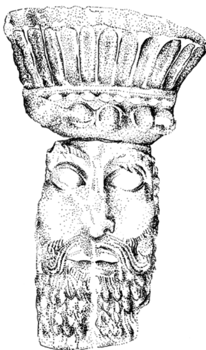
تصویر ۴. موقعیت سردیس و تاج (نگارنده، ۱۳۹۹).

شکسته و از بین رفته است و احتمالاً کشیده بوده است. موی محاسن پیچیده و مجعد است. ابروان پرپشت و پیشانی آن بلند به تصویر کشیده شده که البته ادامه آن در قطعه تاج نمایان است. موی مجعد روی گوش چپ مشاهده می‌شود. روی هم‌رفته به نظر مردی مقتدر با صورت بی‌روحو می‌آید. این قطعه بسیار شبیه به نمونه‌های هخامنشی است و اگر در جای دیگری به دست می‌آمد شاید آن را هخامنشی می‌پنداشتند، این سبک ساخت را ساسانیان از اسلاف خود به ارث برده‌اند در حقیقت هنر ساسانی در ابتدای امر کاملاً وارث گذشته ایرانی است (تصویر ۴)، غیر از تاج، صورت این پادشاه شبیه به شاپور اول و هرمز اول است. محاسن این شهریار با محاسن اردشیر اول، بهرام اول و بهرام دوم تفاوت دارد، ولی هنگامی که بحث تطبیق تاج به میان می‌آید، اختلافات جدی مشاهده می‌شود. تاج این شاه با هیچ‌کدام از شاهانی که احتمالاً در بیشاپور زیسته‌اند، مطابقت نمی‌کند و او را شبیه به نرسه نشان داده است، ولی تاکنون نشانی از سلطنت نرسه از بیشاپور به دست نیامده است، این موضوع چالشی را ایجاد می‌کند که چرا این پیکر گچی این‌قدر شبیه به نرسه است؟ آیا این تاج احتمالاً به شکل نمادین روی سردیس ساخته شده است؟ و به خاطر همین نشانه پادشاهی شخص خاصی نیست و یا این‌که نرسه نیز در بیشاپور زیسته است که این موضوع با فعالیت‌های باستان‌شناسی بیشتر و گاه‌نگاری مطلق می‌توان به آن دست یافت.