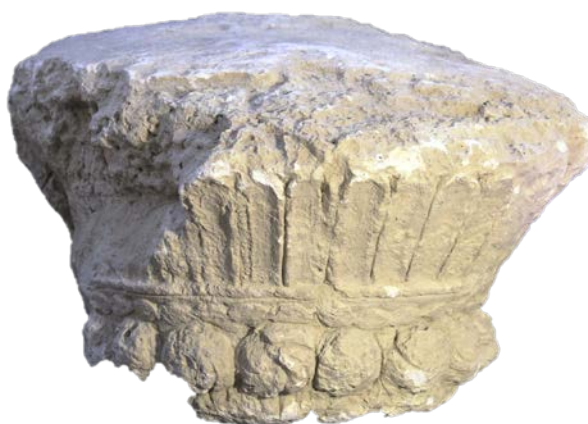
تصویر ۱. قطعه شبیه به تاج (نگارنده، ۱۳۹۸).

قطعه اول تکه‌ای از تاج کنگره‌داری است که روی قطعه دوم که صورت شاهی است قرار می‌گرفته است. قطعه سوم، گوشه‌ای از صورتی است که ظاهراً صورت مردی است و قطعه چهارم، شخصی است که احتمالاً در کنج و گوشه تالار نصب بوده است و دستاری بر سر دارد.