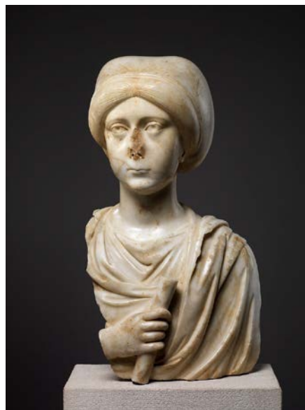
تصویر ۱۱. بانوی مرمین موزه متروپلیتن.

همچنین نمونه این دستار نیز در یک پیکرک استخوانی یافت‌شده از شوش نیز دیده می‌شود (de Mecquenem, 1934: fig: 65)، این پیکرک بانویی برهنه را که دستانش روی سینه قرار دارد و دستاری بر سر دارد نشان می‌دهد.