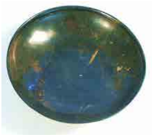
شکل ۸: بشقاب مفرغی مکشوفه از عمارلو.