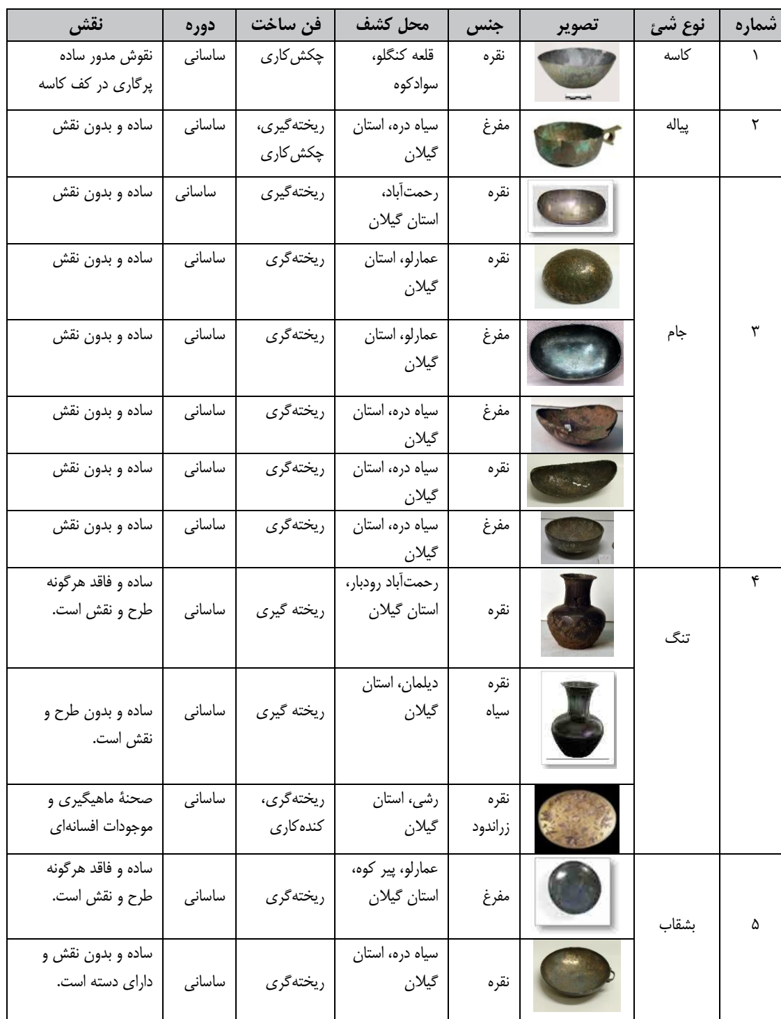
Table 2: Information about metal utensils of the Sassanid period, Northern Iran (Authors 2025).

گیرشمن»، «آرتور کریستین سن»، «ادیت پرادا»، «ریچارد فرای»، «گانتر آن»، «سی. پل جت»، «محمدتقی احسانی»، «تورج دریایی» و... آورده شده است که در آن‌ها به نوع فلز و چگونگی ترکیبات آن در ساخت ظروف، شکل ظروف، نحوه ساخت و موارد استفاده از این ظروف پرداخته شده است و یا این‌که پژوهش در حد گزارش‌های باستان‌شناسی و رساله‌های دانشجویی است؛ در ادامه به تحقیقات انجام شده مربوط به