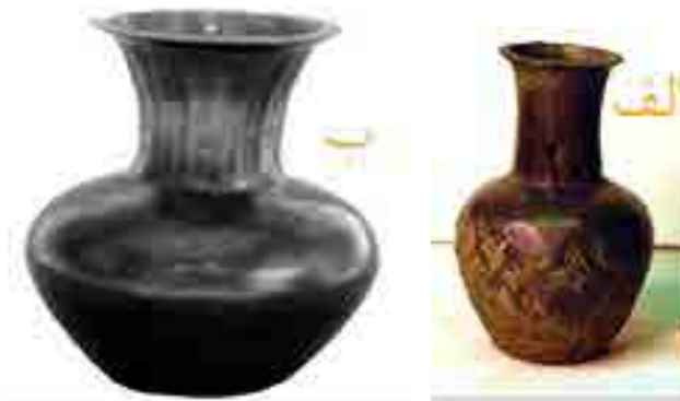
شکل ۶: تنگ‌های نقره، ساسانی، دیلمان، رحمت‌آباد (آرشیو موزه ملی). Fig. 6: Silver Straits, Sassanid, Deilman, Rahmatabad (National Museum Archive).