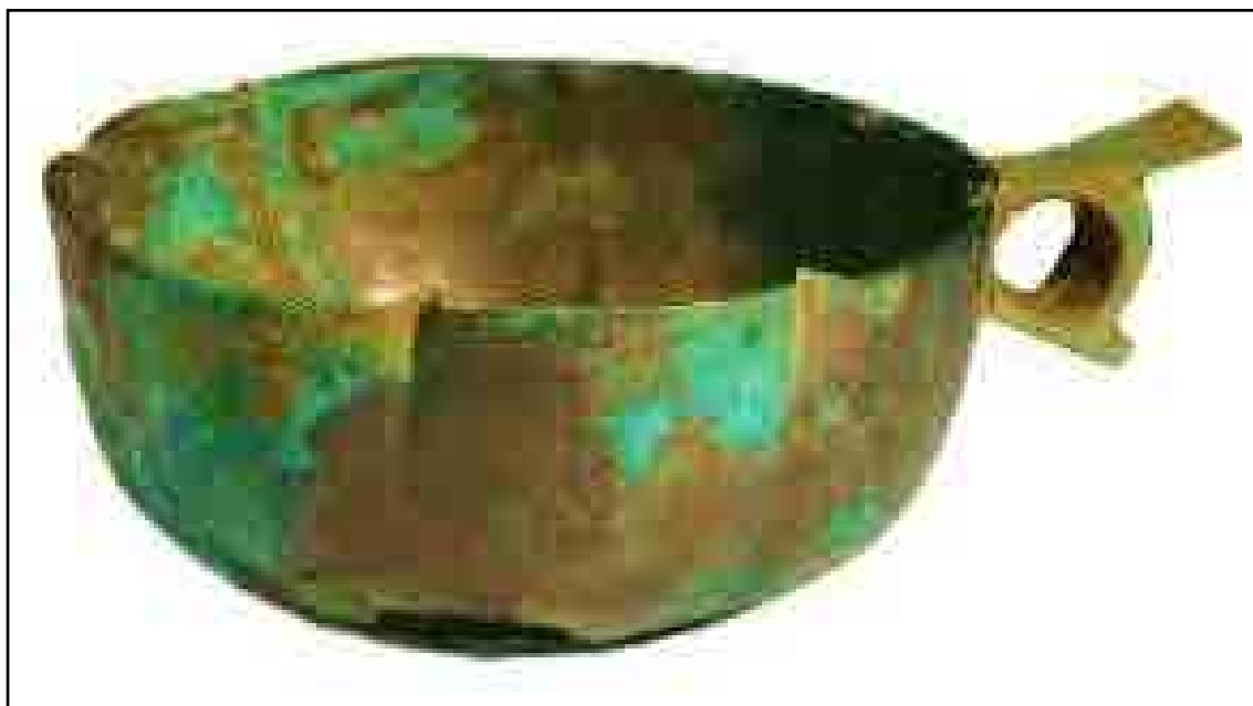
شکل ۳: پیاله مفرغی، سیاه‌دره، دوره ساسانی (آرشیو موزه ملی). Fig. 3: Bronze cup, Black Valley, Sassanid period (National Museum Archive).

پیاله: از دیگر گورآوندهای مکشوفه از گورستان‌های دوره ساسانی پیاله‌ها هستند. جنس این ظروف عموماً مفرغ، نقره و... بوده و برای نوشیدن مایعات نظیر آب و شیر و... استفاده می‌شده است. نمونه‌ای از این پیاله‌ها در محوطه سیاه‌دره استان گیلان در کاوش سال ۱۳۴۵ ه.ش. کشف گردیده است (یاسی و صراف، ۱۳۴۵). این پیاله از جنس مفرغ و به شماره ثبت ۳۷۵۶ با قطر دهانه ۱۲/۵ و ارتفاع ۵/۸ سانتی‌متر در موزه ملی نگه‌داری می‌شود. این پیاله به روش ریخته‌گری، چکش‌کاری ساخته شده است. پیاله مذکور به شکل ساده، فاقد هرگونه نقش و دارای دسته‌ای در بدنه است. در ساخت این پیاله، بدنه جدا و دسته جدا ریخته‌گری شده و در انتها دسته به وسیله لحیم به بدنه وصل شده است (شکل ۳).