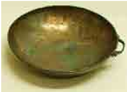
شکل ۹: بشقاب نقره مکشوفه از سیاه دره.