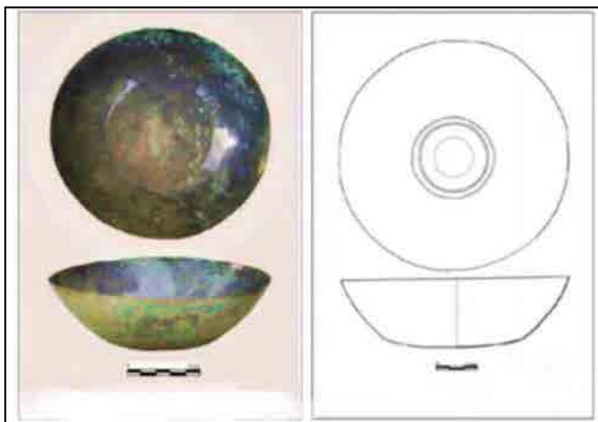
شکل ۲: کاسه مکشوفه از گور قلعه کنگلو سوادکوه (سورتیچی، ۱۳۹۰).

کاسه: کاسه‌ها ظروف بدون دسته و معمولاً مدور (گرد) با لبه‌های بلند هستند که برای نگه‌داری، حمل، خوردن و آشامیدن غذا و مایعات به کار می‌رفته‌اند. تعداد زیادی از این کاسه‌ها در سراسر امپراتوری ساسانی کشف گردیده است. این کاسه‌ها هم دارای ارزش مادی بوده و هم بیان‌کننده جایگاه اجتماعی صاحب آن بوده است؛ هم‌چنین در پی کاوش‌های باستان‌شناختی در محوطه‌ها و گورستان‌های دوره ساسانی شمال ایران تعدادی کاسه از جنس: نقره، مفرغ، سفیدروی و... به دست آمده است؛ در ادامه به یک نمونه از این کاسه‌ها که از گور ساسانی قلعه کنگلو واقع در شهرستان سوادکوه استان مازندران به دست آمده است، تشریح می‌شود: این کاسه کروی شکل، بدون پایه و از جنس سفیدروی ۲ (مفرغ با درصد بالای قلع) است و پوششی بسیار نازک از زنگار بخش‌هایی از آن را فرا گرفته است. کف کاسه با نقوش مدور ساده پرگاری، تزئین شده است. در این کاسه شکل دایره چندین بار تکرار شده است. در لبه ظرف مکشوفه شکستگی‌هایی با لبه تیز مشاهده می‌شود؛ که معرف شیوه تولید آن به روش چکش کاری است. ظروف سفیدروی سواحل جنوبی دریای مازندران که مربوط به سده هفتم و هشتم میلادی (اواخر ساسانی) است (شکل ۲)، (سورتیچی، ۱۳۹۰: ۸۵).