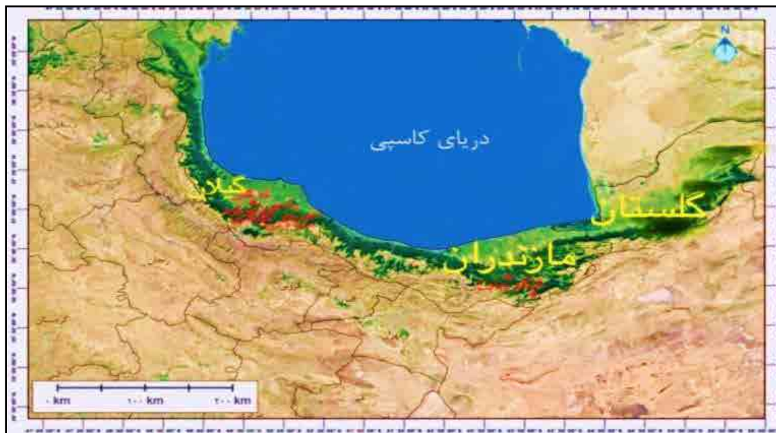
شکل ۱: موقعیت جغرافیایی و گورستان‌های ساسانی، شمال ایران (گوگل‌مپ).

آن‌ها ظروف فلزی به دست آمده عبارتند از: قلعه کنگلو سوادکوه، استان مازندران، (سورتیجی، ۱۳۸۵؛ ۱۳۹۰)، لمه‌کش (یاسی، ۱۳۴۵)، سیاه‌دره، کلیشی، آغوزین (یاسی و صراف، ۱۳۴۵)، سیاه‌کوه، عمارلو (مقدم، ۱۳۴۰)، رشی (گنجوی و همکاران، ۱۳۴۵)، دیلمان (هیأت ژاپنی ۱۹۷۱-۱۹۶۵) و رحمت‌آباد (یاسی، ۱۳۴۵) استان گیلان (نقشه ۱)، (جداول ۱ و ۲).