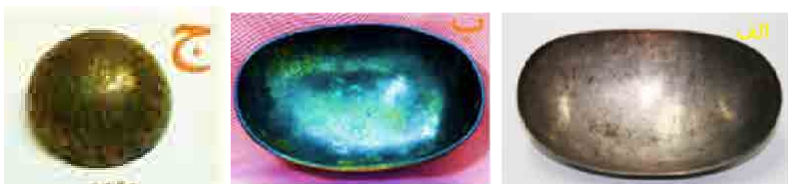
شکل ۴: جام نقره مکشوفه از رحمت‌آباد رودبار و عمارلو (آرشیو موزه ملی).