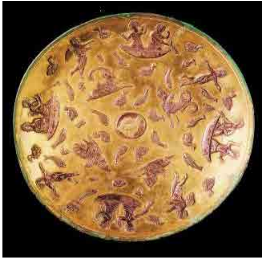
شکل ۷: جام نقره زراندود مکشوفه از رشی.