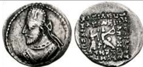
www.vcoins.com تصویر ۲- سکه اورتاگون (گوندوفر و

گادانا)، ضرب ضربخانه سیستان، روی سکه تصویر شاه و پشت