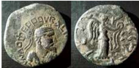
www.vcoins.com تصویر ۳- سکه گوندوفر: روی سکه چهره گوندوفر. پشت سکه تصویر الهه نیکه در حالیکه برگ درخت خرما را در دست دارد.

متفاوت داشته است. (خادمی ندوشن، عزیزی‌پور، ۱۳۹۱: ۶۱). محققین احتمال داده‌اند که نام گوندوفر از کلمه ویندافرنه ( Vinda-farna ) (پارشاطر، ۱۳۸۳: ۵۶۵) که به معنی دارای فر و شکوه است (دوبواز، ۱۳۴۲: ۴۸)، مشتق شده باشد.