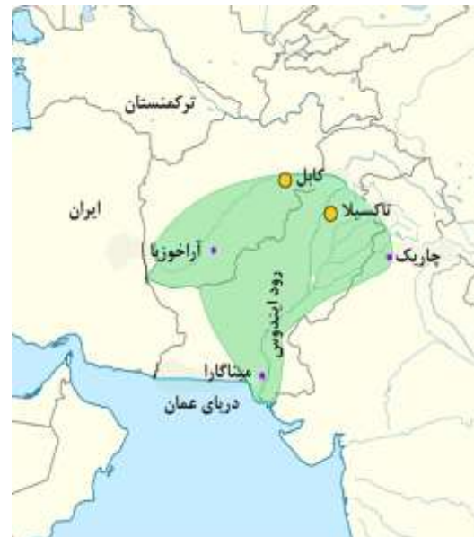
نقشه ۲. مسیر کشور گشایی گوندوفر