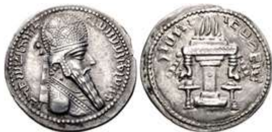
تصویر ۱۱- درهم نقره اردشیر

اردمیترا ( Arda-mitra ) استانداری بود که از طرف اردشیر در سال ۲۳۰ م حاکم قلمرو اشکانیان هند شد. سکه‌های او با سکه‌هایی که پیش از این اشکانیان هند در آراخوسیا و سیستان ضرب کرده بودند شباهت بسیاری دارد. با این حال بر سکه‌های اردمیترا (تصویر ۱۰) - بر خلاف سکه‌هایی که حاکمان هند و پارسی ضرب کرده‌اند - نقش آتشکده دیده می‌شود ( Macdowall, 1965: 145 ) اگر به یاد بیاوریم که نقش آتشکده بر تمام سکه‌های اردشیر (تصویر ۱۱) دیده می‌شود (کریستین سن، ۱۳۸۴: ۱۱۵)، آنگاه می‌توانیم وجود این نقش بر سکه‌های اردمیترا را نشانه پایان یافتن قدرت اشکانیان هند بدانیم.