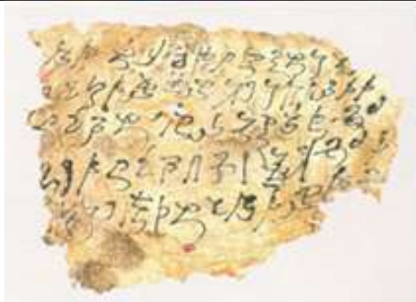
تصویر ۱- کتیبه کهروشتی تخت باهی

گذشته از کاستی‌های ذکر شده حکومت اشکانیان هند در سال‌های اخیر مورد توجه برخی پژوهشگران قرار گرفته است. برخی از این پژوهشگران شاهان اشکانی و سکایی هند را از یکدیگر جدا نکرده و در بین پادشاهان دو حکومت مزبور حد و مرز مطالعاتی مشخصی قرار نداده‌اند (دوبواز، ۱۳۴۲: ۴۶-۴۹، محمدی، ۱۳۹۵، ۱۰۳-۱۲۴، زرین‌کوب، ۱۳۷۶: ۱۶۵، دیاکونوف، ۱۳۷۸: ۷۵). اما برخی دیگر دو حکومت اشکانی و سکایی هند را دو حکومت جدا از یکدیگر می‌دانند. در بین گروه اخیر توالی شاهان اشکانی هند (بیوار، ۱۳۸۳: ۲۹۲)، ارائه کلیاتی درباره این حکومت (خادمی‌ندوشن، عزیزپور، ۱۳۹۱: ۶۸-۵۹)، مطالعه مرزهای سیاسی (Mc Dowell, 1939: 781-801) و یا مطالعه سکه‌های شاهان اشکانی هند موضوع پژوهش بوده است (Thomas, 1870: 503-521).