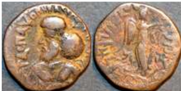
تصویر ۸- چهار درهمی پاکور، روی سکه نیم تنه پاکور به سمت چپ، پشت سکه نیکه بالدار به سمت راست.

برخی محققین پاکور را جانشین ابدگاسی ( Rapson, 1922:573 ) و برخی دیگر او را پادشاهی می‌دانند که جانشین گوندوفر شده است (دوبواز، ۱۳۴۲: ۴۹). پاکور، لقبی اشکانی و به معنای فیروز است. سیمونتا او را فرزند گوندوفر می‌داند ( Simonetta, 1974:285 ). میچینر دوران حکومت او را بین سال‌های ۱۱۰-۱۳۵ میلادی ( Mitchiner, 1973:354 ) (بعد از فرمانروایی ابدگاسی) قرار می‌دهد. سکه‌های پاکور در ابرشهر، مرو، هرات و تاکسیلا به دست آمده است. بر آن دسته از سکه‌های پاکور که از تاکسیلا به دست آمده تصویر الهه نیکه که نماد پیروزی است (تصویر ۸)، دیده می‌شود این سکه‌ها به وضوح نشان می‌دهند که پاکور موفق شده بود ویم کادفیس - پادشاه کوشانی - را از تاکسیلا بیرون کرده و خود بر این منطقه فرمانروایی کند (دوبواز، ۱۳۴۲: ۴۹). عدم پیدا شدن سکه‌های پاکور از کابل ما را متقاعد می‌کند که او نیز - همچون ابدگاسی - نتوانسته بود بر منطقه مزبور حکومت کند. پاکور آخرین شاه اشکانی هند است که توانست بر گندهارا حکومت کند ( Rapson, 1922:580 ). بعد از او روند سقوط شاهان اشکانی هند آغاز شد. برخی محققین همزمان با پاکور از شاه دیگری به نام سنابارس ( Sanabares ) یاد می‌کنند. به نظر می‌رسد این دو پادشاه در دو منطقه متفاوت حکومت می‌کرده‌اند؛ پاکور بر ابرشهر، تاکسیلا و هرات حکومت می‌کرده و سنابارس احتمالاً سیستان را در اختیار داشته است ( Macdowall, 1965:143-144 ).