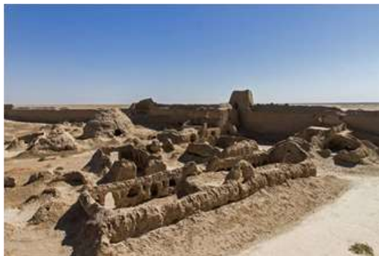
تصویر ۴ - ویرانه‌های قلعه رستم