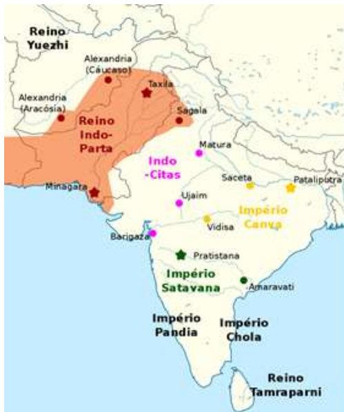
نقشه ۱. قلمرو حکومت اشکانیان هند

محدوده جغرافیای سیاسی حکومت اشکانیان هند از زمان تأسیس تا زمانی که این حکومت به‌طور کامل به‌وسیله اردشیر ساسانی منقرض شد با تغییرات بسیاری همراه بوده است. اشکانیان هند اگر چه توانسته بودند سرزمین‌های قبلی هند و سکایی‌ها را تسخیر کنند؛ اما در مواردی بازمانده‌های حکومت سکاها هند به قلمرو حکومت اشکانیان هند حمله می‌کردند و موقتاً برخی نواحی را از اشکانیان هند بازپس می‌گرفتند (گوتشمید، ۱۳۷۹: ۲۰۵). قلمرو سیاسی آنها در روزگار اوج قدرتشان شامل سیستان، بخش‌هایی از افغانستان و پاکستان و بخش‌های شمال غرب هند بوده است (نقشه ۱). این قلمرو وسیع را استانداران تحت فرمان آنها - که غالباً از اعضای خانواده سلطنتی بودند- اداره می‌کردند (خادمی ندوشن، عزیزی پور، ۱۳۹۱: ۵۷).