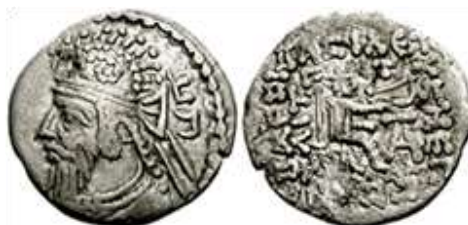
تصویر ۹- سکه سنابارس ضرب ضرابخانه سیستان با خط یونانی

پادشاهان مختلفی با نام سنابارس در اواخر حکومت اشکانیان هند بر تخت سلطنت نشستند (Simonetta, 1974: 287). سلوود زمان حکومت اولین سنابارس را بین سال‌های ۶۰-۵۰ میلادی قرار می‌دهد (Selwood, 1980:305). او حاکم مرو بوده و از طریق روابط خانوادگی و ازدواج با خانواده گوندوفر ارتباط داشته است. پیدا شدن سکه‌های او در سیستان از یک طرف و کاربرد خط یونانی (تصویر ۹) بر این سکه‌ها از طرف دیگر نشان می‌دهد که او توانسته بود بر این منطقه حکومت کند (Nikintin, 1994:69). بعد از سنابارس اول، احتمالاً سنابارس دوم و سوم در مرو حکمرانی کرده‌اند. به گواهی سکه‌ها در اواخر حکومت اشکانیان هند شاهان دیگری همچون پارهاس اول و دوم و سمارا نیز بر قلمرو رو به زوال شاهان اشکانی هند حکومت کرده‌اند (خادمی ندوشن، عزیزی‌پور، ۱۳۹۱: ۶۷)؛ اما از این پادشاهان جز نامی که بر سکه‌ها آمده اطلاع دیگری در دست نیست.