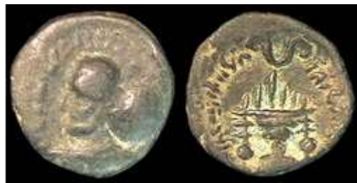
تصویر ۱۰- سکه اردمیترا با نقش آتشدان در پشت سکه