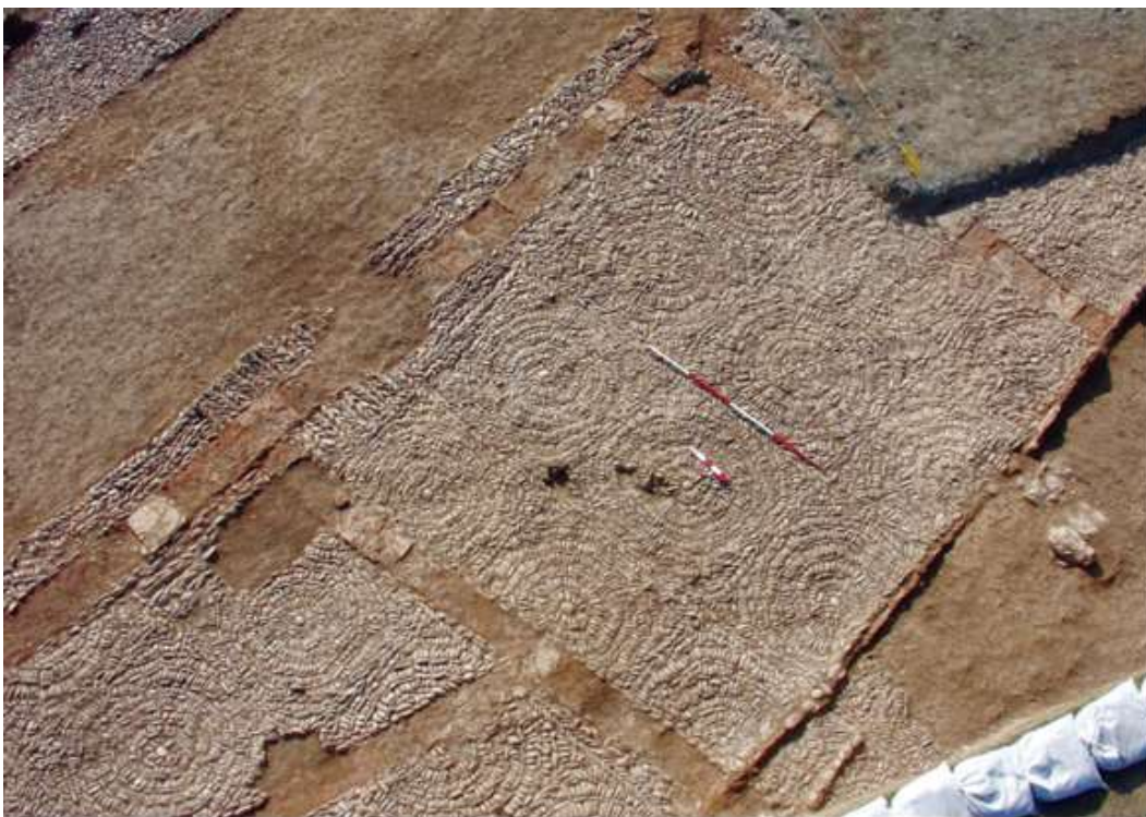
تصویر شماره ۴: نمایی از سنگفرش‌های دایره‌تی شکل تپه ربط ۲ (Heidari 2010: Table XLIX.2)