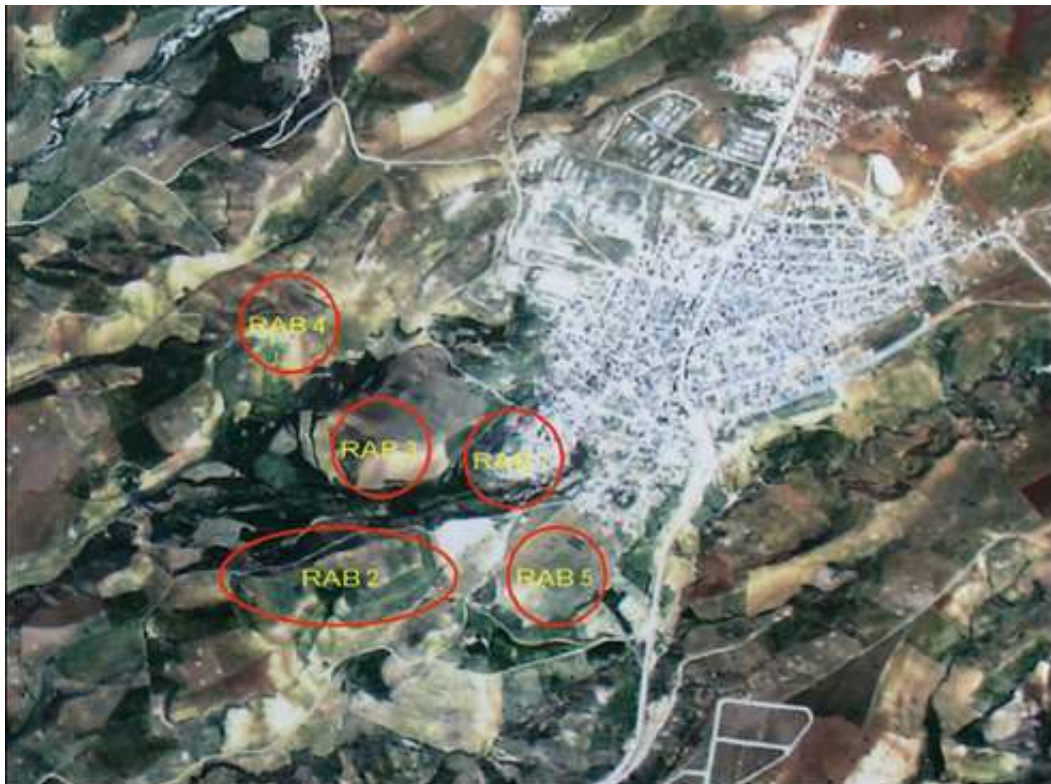
تصویر شماره ۳: موقعیت تپه‌های پنج‌گانه ربط در حاشیه شهر ربط (Heidari 2010: Table XLVII.2)