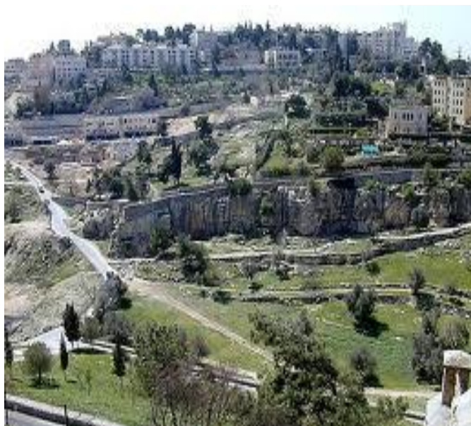
تصویر ۱- منطقه امروزی توفت