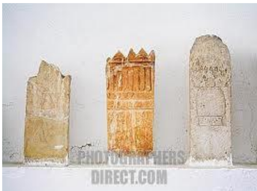
تصویر ۳- استل‌های به دست آمده در کاوش‌های باستان‌شناسی