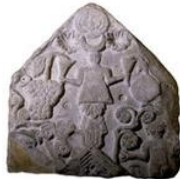
تصویر ۴- استل‌های به دست آمده در کاوش‌های باستان‌شناسی