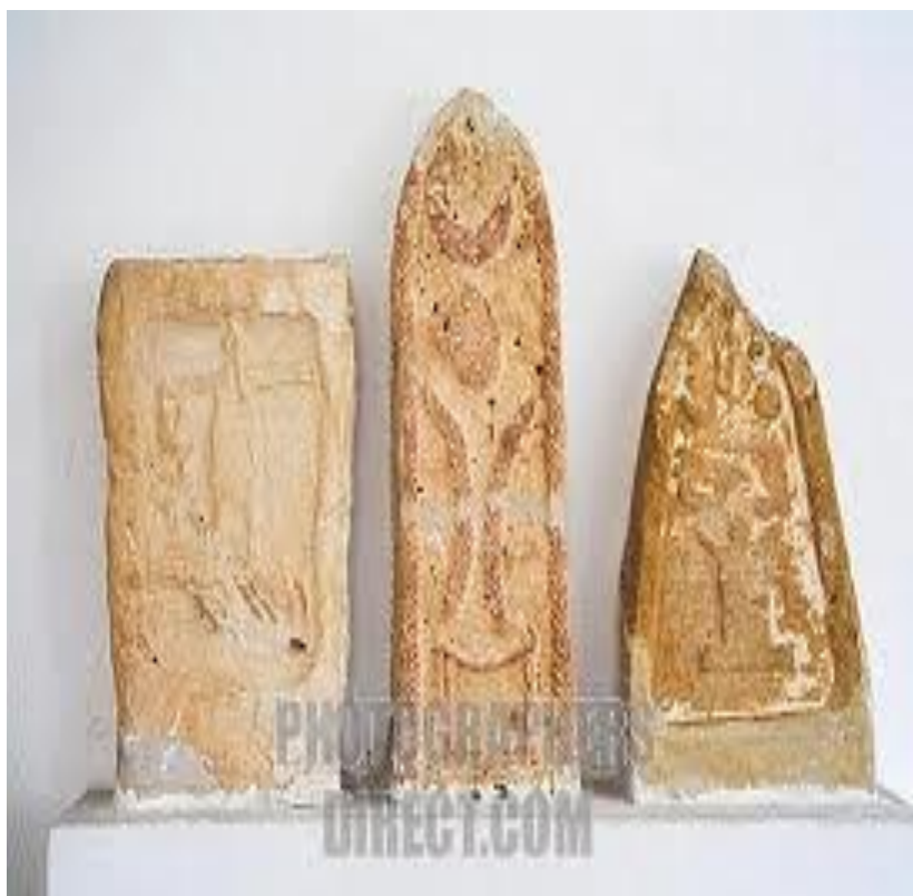
تصویر ۲- استل‌های به دست آمده در کاوش‌های باستان‌شناسی